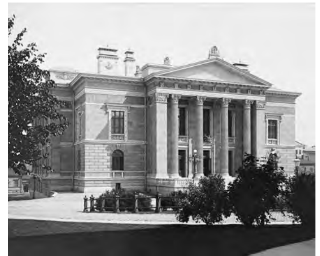
Kuva noin 1890, Ståhlberg. Helsingin kaupunginmuseo.

Ensimmäisessä väriarussaan Säätytalon kaikki keskeiset julkisivupinnat oli kalkattu, mutta ei suinkaan yksivärisen sileiksi, vaan punaista hiekkakiveä ja vaaleaa marmoria imitoiviksi eloisiksi pinnoiksi. Peruskorjauksessa vuosien 2023-2025 aikana julkisivukunnostuksessa päädyttiin käyttämään tätä ensimmäistä asua valitun värimaailman esikuvana. Kalkkimaalilla tehtävän imitointimaalauksen yhtenä haasteena on maalityypin voimakas vaaleneminen ja peittokyvyn voimistuminen sen kuivuessa. Imitointityön tuloksen näkee siis vasta, kun pinta on kuivunut.